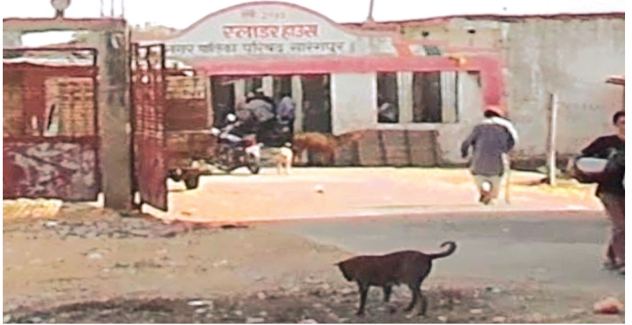
हरिभूमि न्यूज | सारंगपुर

प्रदेश की राजधानी भोपाल में हाल ही में बड़े स्तर पर गो मांस जब्तों की कार्रवाई के बाद भी स्थानीय प्रशासन की उदासीनता सामने आ रही है। सारंगपुर नगर में संचालित स्लॉटर हाउस बिना किसी वैध लाइसेंस के खुलेआम पशु वध का कार्य कर रहे हैं, वो भी विगत दो वर्षों से लेकिन जिम्मेदार अधिकारी इस गंभीर मामले से पूरी तरह बेफिक्र नजर आ रहे हैं। जानकारी के अनुसार सारंगपुर में वर्तमान में दो स्लॉटर हाउस संचालित हैं, जिनमें नगर पालिका परिषद अथवा सक्षम विभाग से कोई वैध अनुमति या लाइसेंस नहीं लिया गया है। इसके