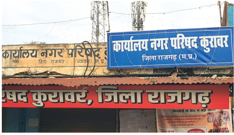
ब्यावरा-कुरावर

विगत महीने इंद्रौर में दूषित पानी पीने से बीमार हुए लोगों की मौत की घटना के बाद से प्रदेश भर में पेयजल स्रोत की जांच की गई। इसी के चलते कुरावर नगर में स्थित विभिन्न जलस्रोतों की कार्यालय अनुविभागीय दण्डाधिकारी नरसिंहगढ़ के निर्देश पर नगर परिषद कुरावर द्वारा निकाय क्षेत्र के विभिन्न वाडों में स्थित शासकीय कुओं और निजी कुड़ियों के जल के नमूने लोक स्वास्थ्य यांत्रिकी पीएचई विभाग द्वारा जांचे गए। जांच रिपोर्ट में नगर के 6 जलस्रोत का पानी पीने योग्य नहीं पाया गया है। नगर में करीब 30 हजार की आबादी है तथा नगर में 15 वाडों के निवासी पेयजल के लिए निजी जलस्रोत का उपयोग वर्षों से करते चले आ रहे हैं।