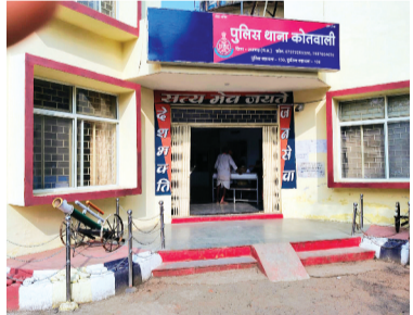
हरिभूमि न्यूज | ब्यावरा