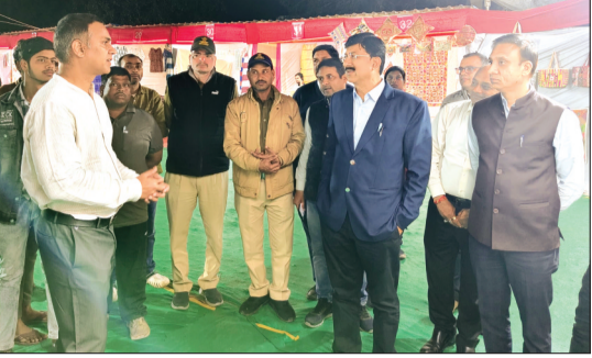
हरिभूमि न्यूज गुना

पुलिस अधीक्षक के सशक्त एवं संवेदनीय नेतृत्व में फरार आरोपियों पर गुना पुलिस की प्रभावी कार्रवाई