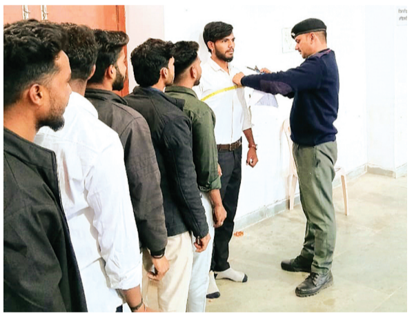
हरिभूमि न्यूज | ब्यावरा

भारतीय सुरक्षा दस्ता परिषद नई दिल्ली एवं भारत सरकार पसारा एक्ट 2005 के अंतर्गत रोजगार कार्यालय के सहयोग से सिस्कोरिटी रिस्कल काउंसिलिंग इंडिया लिमिटेड जयपुर द्वारा ग्रामीण व शहरी शिक्षित युवाओं को सुरक्षा जवान के पद पर भर्ती कैंप मंगलवार को जनपद